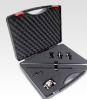
Kit Kompass 040205