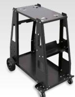
Fahrwagen PLASMA 600 040298