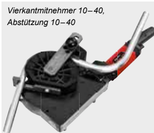
Vierkantmitnehmer 10–40, Abstützung 10–40