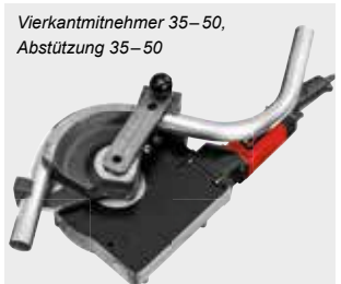
Vierkantmitnehmer 35–50, Abstützung 35–50