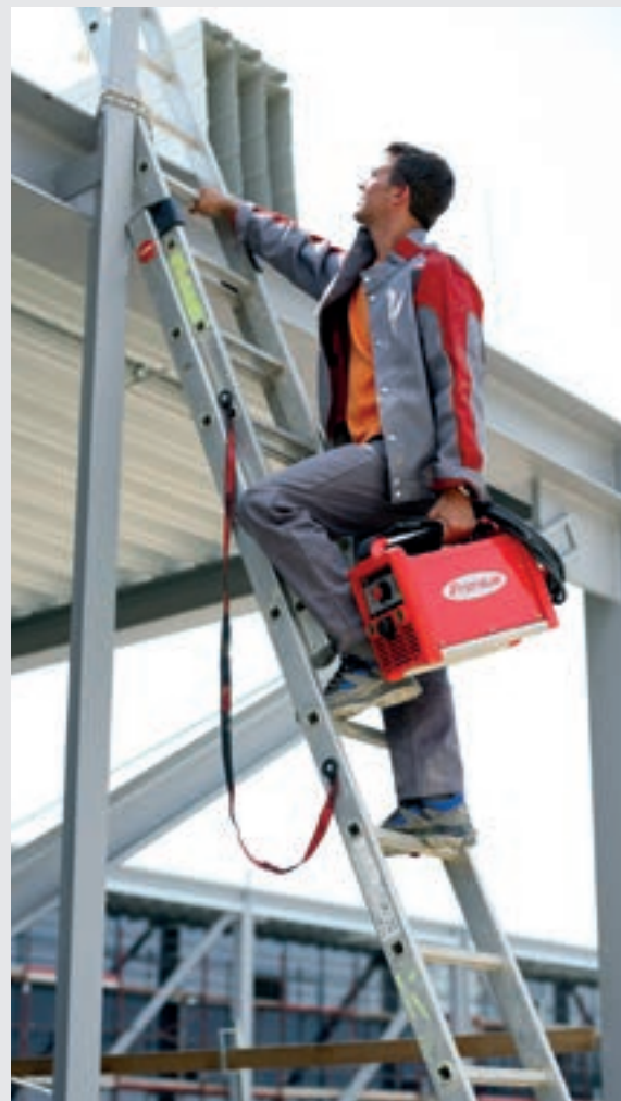
/ Leicht und mobil und somit auf jeder Baustelle zu Hause.