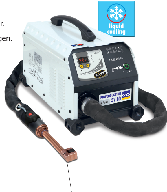
mit einem Induktor-Komplettsset 90° geliefert.