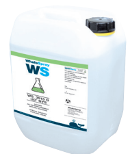
Art.-Nr. 062511 Kühlmittel für Schweißgeräte - 5 l