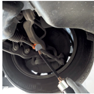
Entsperrung von Lenkgestängen